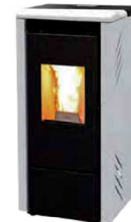
Bianco - White Blanc - Blanco Λευκό - Weiß белая