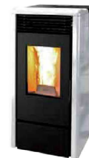
Bianco - White Blanc - Blanco Λευκό - Weiß Белая