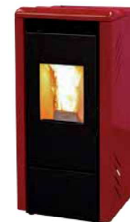
Rosso - Red Rouge - Rojo Κόκκινο - Bordeaux Красный