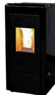
Nero - Black Noir - Negro Schwarz - Μαύρο черныйхх