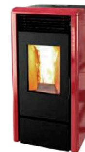
Rosso - Red Rouge - Rojo Κόκκινο - Bordeaux Красный