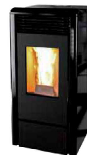
Nero - Black Noir - Negro Schwarz - Μαύρο черный