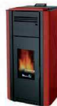
Rosso - Red Rouge - Rojo Κόκκινο - Bordeaux Красный