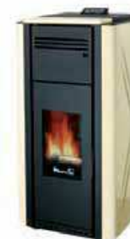
Pergamena - Ivory Ivoire - Marfil Ιβουάρ - Elfenbein слоновой кости