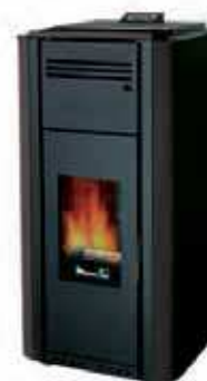
Nero - Black Noir - Negro Schwarz - Μαύρο черныйхх