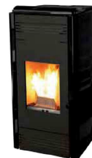
Nero - Black Noir - Negro Schwarz - Μαύρο черный