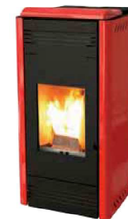
Rosso - Red Rouge - Rojo Κόκκινο - Bordeaux Красный