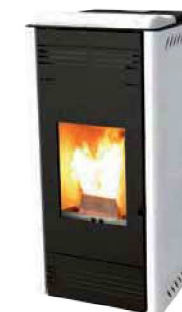
Bianco - White Blanc - Blanco Λευκό - Weiß Белая