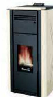
Bianco - White Blanc - Blanco Λευκό - Weiß белила