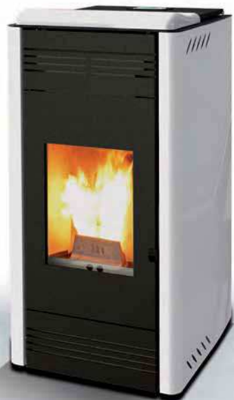
Iride model MF13WH

Покрытие из эмалированного металла и майолика на верхней части печи создают гармоничный и очень эстетичный внешний вид. Она идеально подходит для небольших помещений благодаря мощности 13 кВт.